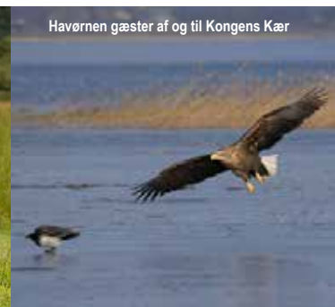
Havørnen gæster af og til Kongens Kær