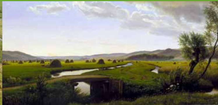
P.C. Skovgaard: "Den store eng ved Vejle. Sommereftermiddag 1867". Tilhører Vejle Kunstmuseum.

meltpind i midten af 1900-tallet. En af landets mest populære kroer, Trædballehus, en lysthave og ikke mindst Vejles første zoo, der skulle blive forløberen for Givskud Zoo, lå dengang ved Himmelpind.