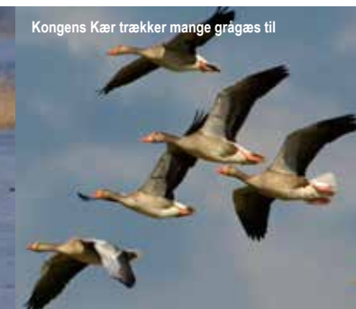
Kongens Kær trækker mange grågæs til