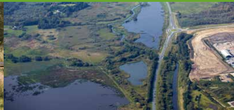
Kongens Kær og Knabberup Sø set fra oven