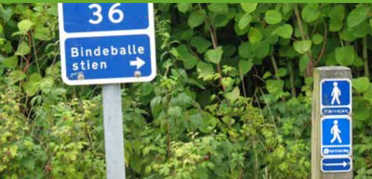
Kyst til Kyst Stien og Hærvejsvandre- ruten forløber langs Bindeballestien