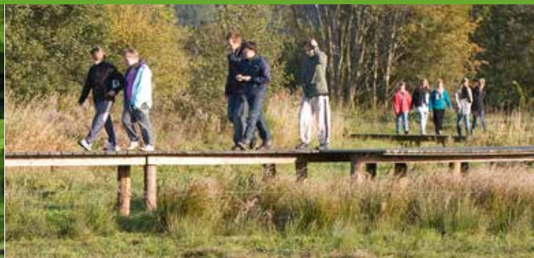
Gangbro på stien langs med Kongens Kær