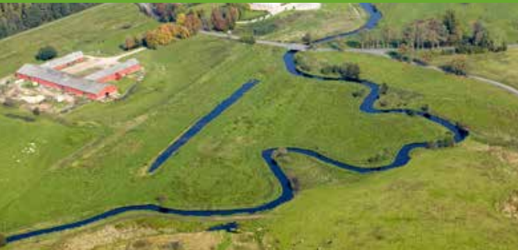
Den genslyngede å ved Haraldskær, hvor man stadig kan se de lige afvandingskanaler

væk i 30-35 år, og når den nu er vendt tilbage, er det, fordi mange års naturforbedringer af åen har båret frugt. Der lever skønsmæssigt 40-50 oddere i Vejle Ådal.