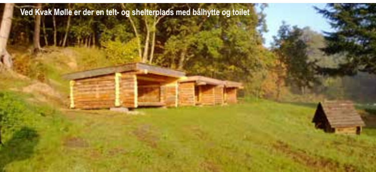
Ved Kvak Mølle er der en telt- og shelterplads med bålhytte og toilet

Ca. 6 km cykeltur. Fra Avlsgården følges Møllevejen langs de stynede popler forbi ruinen af Kvak Mølle. Videre ad Fabriksvejen gennem Helligkilde Skov med kildebrønd og afvekslende skov, forbi Haraldskær Fabrik og Dronningens Mose, hvor moseliget af dronning Gunhild lå, og retur gennem det åbne herregårdslandskab.