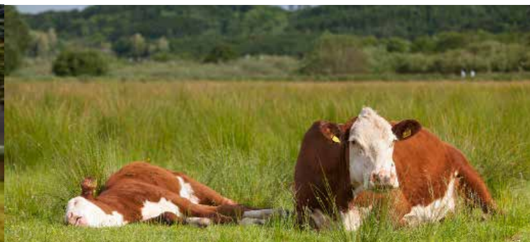
Kær holder engene åbne